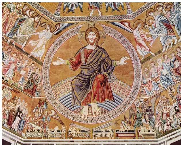
Il giudizio universale